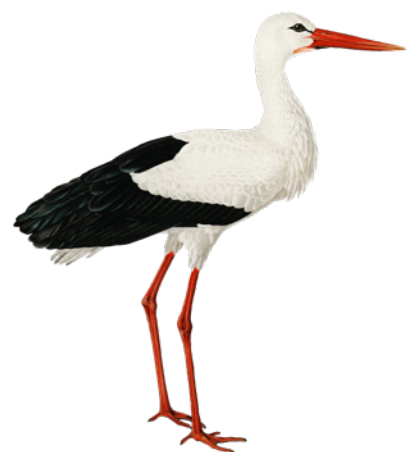
FIG. 1. — OOIEVAAR ( CICONIA CICONIA )

De ooievaar is een vogel uit de familie van de ooievaars. Ooievaars zijn een groep grote vogels met lange poten en een lange hals. Zij hebben een lange, rechte en stevige snavel. De ooievaar wordt ook wel uiver, eiber of stork genoemd.